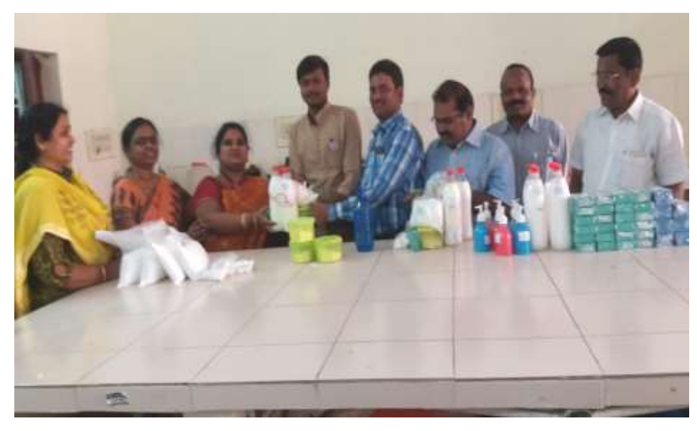
The faculty members of Physics purchasing the products made by the students